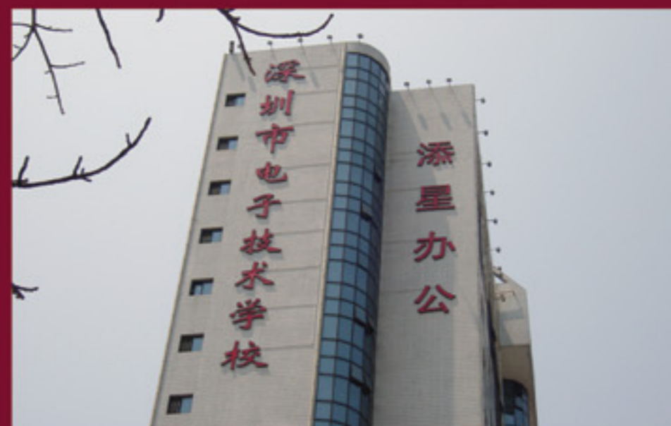
深圳上課地點：深圳市電子技術學校綜合樓

本學院保留隨時修改課程的權利，包括時間表、收費及課堂模式，而毋須另行通知。 本學院保留權利決定是否接受任何入學申請，所有申請將由財政部財政科學研究所甄別及選錄。 個別僱主可酌情決定是否承認本課程可令學員獲取任何資格。