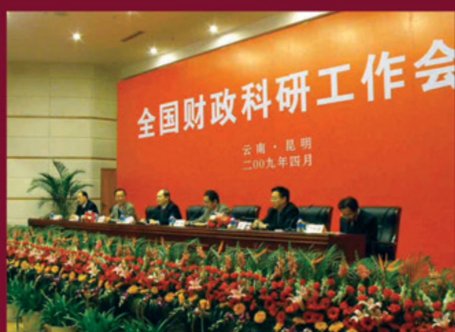
全國財政科研工作會

「財政部財政科學研究所」直屬於中華人民共和國財政部，是經國家教育部、國務院學位委員會批准，負責博士、碩士研究生學歷及學位授予的單位，除專注於培養財政、會計、國民經濟、企業管理等方面高級人才的任務外，研究所並肩負著為國家財經理論、政策研究提供決策分析、制定正確的財政方針政策及提高財政工作管理水平的重任。