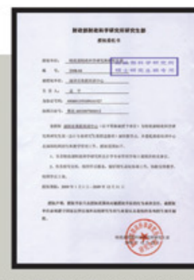
「財政部財政科學研究所」授權委託書