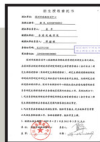
香港招生授權委託書