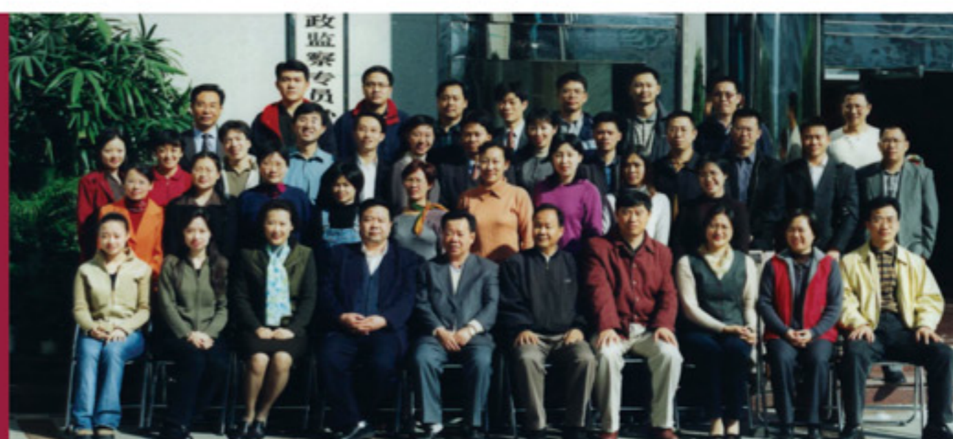
「財政部財政科學研究所」碩士研究生課程畢業生紀念照