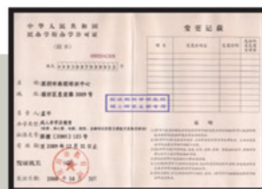
中華人民共和國辦學校許可證

「香港優越學院」已正式成為中華人民共和國「財政部財政科學研究所」之《管理學碩士》及《會計專業碩士》研究生課程的招生代表，依據與深圳市珠聯培訓中心之授權委託，「香港優越學院」是香港唯一獨家負責研究生課程在香港地區範圍內一切招生工作的教育機構。