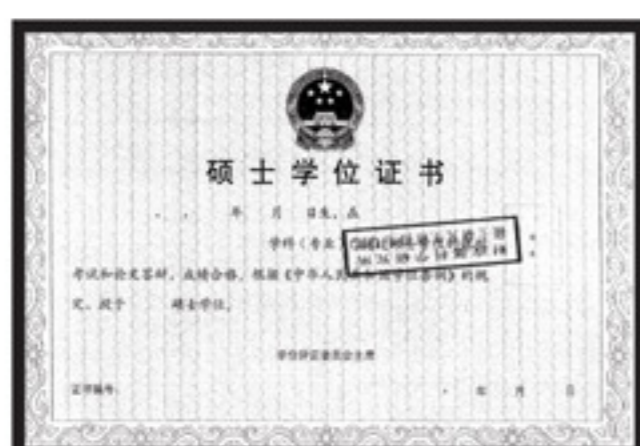
全國統一《碩士學位證書》